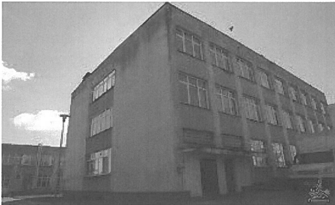
Stan przed okresem rewitalizacji