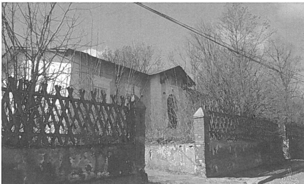
Obszar realizacji zadań rewitalizacyjnych przed okresem rewitalizacji – budynek dawnej Harcówki